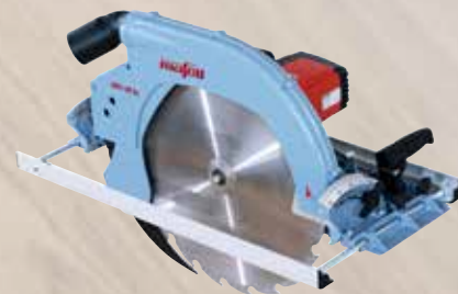
Tesařská - ruční kotoučová MKS 185 Ec