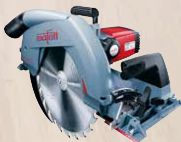
Tesařská - ruční kotoučová MKS 130 Ec