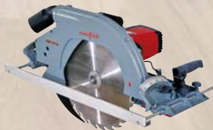
Tesařská - ruční kotoučová MKS 145 Ec / 165 Ec